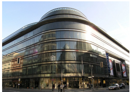
Galeries Lafayette Friedrichstraße