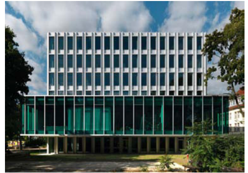
Heinrich Böll Stiftung