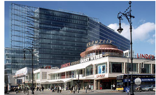
Kranzlereck von Helmut Jahn